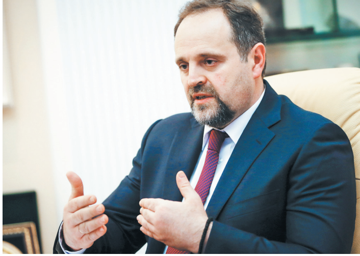
Сергей Донской: Тесное сотрудничество между природоохранными министерствами двух стран началось 16 лет назад.