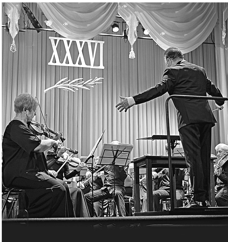
Оркестр Собиновского фестиваля

В Саратове в 36-й раз стартовал Собиновский фестиваль