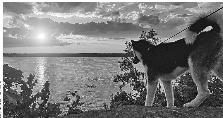
Любая собака не может гулять в населенном пункте без владельца.

– В конце прошлой недели в Саранске собака напала на ребенка, – констатировал премьер. – Также во время рабочей поездки с просьбой о принятии дополнительных мер для отлова бездомных животных ко мне обратились жители Чамзинского района.