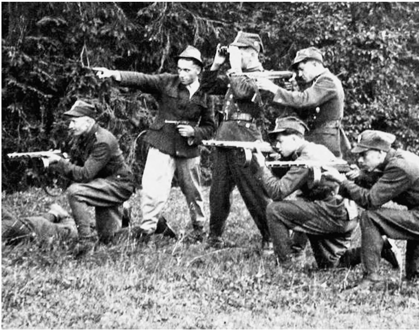
Так называемая польская «самооборона» нападала на лазареты, убивала медсестер, врачей, солдат, едущих в отпуск после ранения...