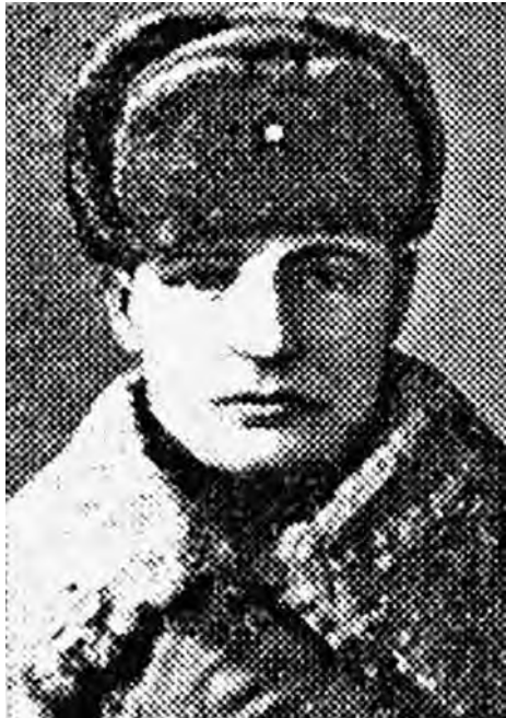
Канарчик получил «Золотую Звезду» за Днепр.