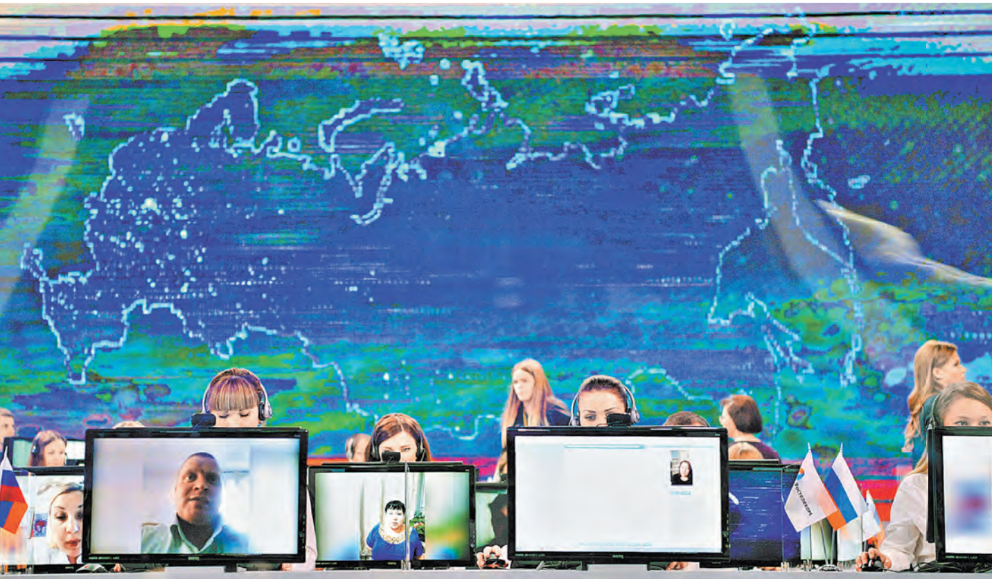
Глава государства убежден, что прямой диалог с гражданами позволяет понять, чем живет страна, и выявить «болевые точки».

Вчера Владимир Путин провел очередную, уже 15-ю по счету, Прямую линию. Разговор в прямом эфире продолжался 4 часа. За это время глава государства ответил на 68 вопросов. Сам президент считает, что пря-