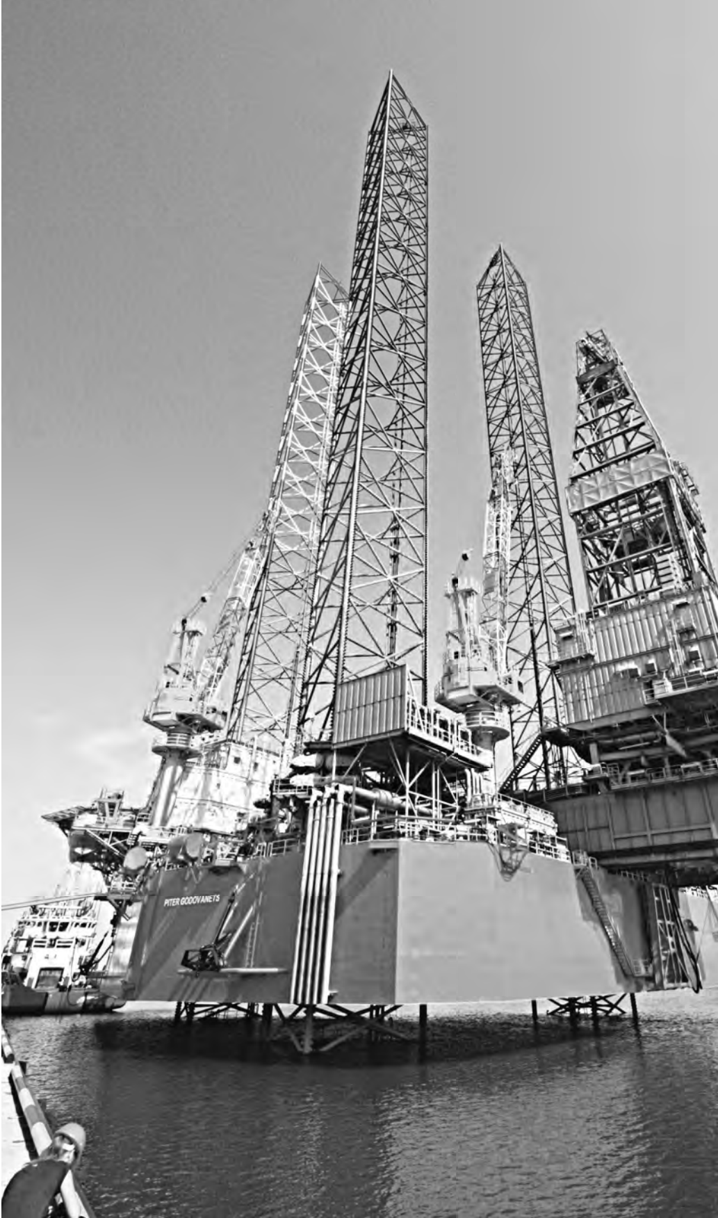
Все мировые производители пытаются нарастить добычу на шельфе. При этом разведанные запасы в Северном Ледовитом океане составляют 25 процентов всех запасов углеводородного сырья на планете.