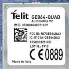
GSM модуль GE864-QUAD automotive V2