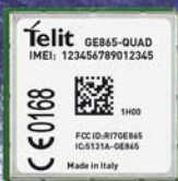
GSM модуль GE865-QUAD