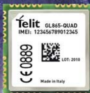
GSM модуль GL868-DUAL