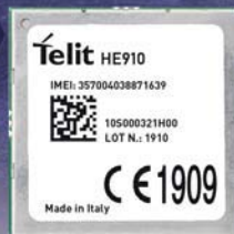
HSPA+ модуль HE910