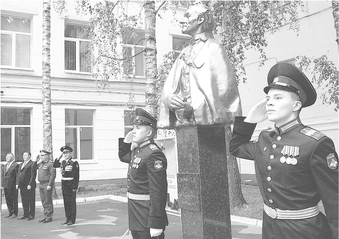
Бронзовый памятник русскому полководцу генералиссимусу Александру Суворову открыли в Твери на территории Суворовского военного училища. Инициаторами акции выступили суворовцы — выпускники разных лет. Дело в том, что в свое время на этом самом месте уже был установлен бюст Суворова, который впоследствии был утрачен. Теперь здесь появился полноценный памятник.

В ШКОЛЕ брянского поселка Пальцо появилась мемориальная доска в честь Федора Журавлева— молодого офицера, погибшего в Сирии. В этой школе учился он сам, а торжество решили провести как раз в день его рождения. Федор погиб 19 ноября 2015 года при выполнении боевой задачи по координации авиаударов по террористическим соединениям в Сирии, 8 декабря 2015 года посмертно награжден орденом Кутузова.