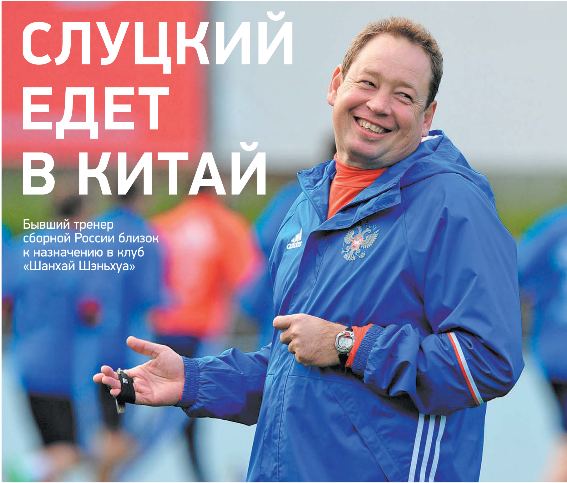
2016 год. Главный тренер сборной России Леонид Слуцкий

Бывший тренер сборной России близок к назначению в клуб «Шанхай Шэньхуа»