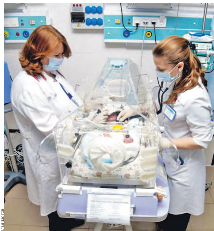
В 2021 году запланировано приобретение для РДКБ еще 23 единиц медтехники.