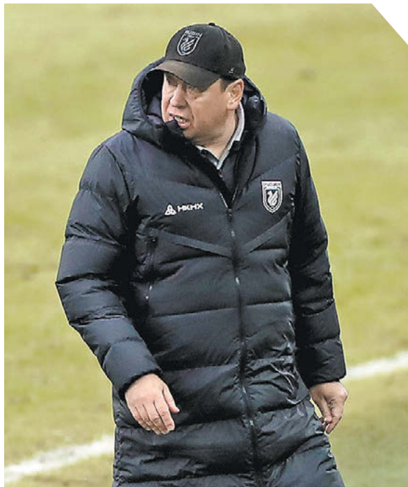
Александр Федоров «СЗ» / Canon EOS-1DX Mark II