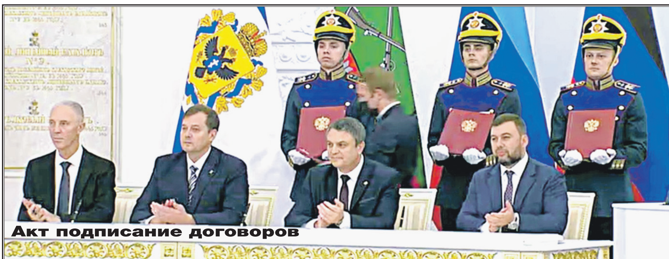
Акт подписание договоров

— Сегодня мы сражаемся за то, чтобы никому и никогда не пришло в голову, что наш народ и культуру можно вычеркнуть из истории. Нам нужна консолидация истории. В основе такой истории должен быть суверенитет. Позволю закончить свое выступление словами Ильина: «Если я считаю моей Родиной Россию, то это значит, я по-русски люблю, созидаю и думаю. Что я верю в духовные силы русского народа. Его страдания — мое горе, его расцвет — моя радость». За нами правда, за нами Россия! — завершил выступление президент России.