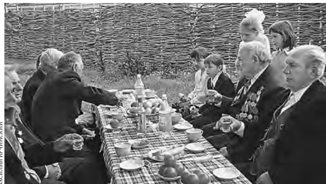
В этом году ветераны не соберутся за общим столом, как раньше.