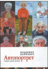
Войнович В. Автопортрет: Роман моей жизни. М.: Эксмо, 2010. — 880 с.

3 «Мнение человека о самом себе — это всего лишь одно из мнений», — честно признается автор в предисловии. О своей жизни Владимир Войнович немного рассказывал и раньше — в книгах «Иванькиада», «Дело №34840», «Замысел», но этот объемистый том — первая полноценная автобиография отца солдата Ивана Чонкина — череда «находок, потерь, иллюзий, разочарований», и главное — попытка самосознания.