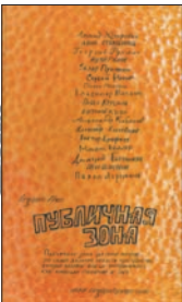
Публичная зона: Антология. М.: Гаятри/Livebook, 2009. — 416 с. — (Organic Prose).

1 Этот сборник рассказов — первая часть трехтомного проекта «Organic Prose». Служит он благородному делу — напомнить российским читателям о том, что не одними романами жива современная отечественная литература, и что несправедливо подзабытая издателями и потребителями малая проза у нас ничем не хуже большой. И может быть, даже разнообразнее.