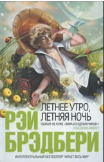
Брэдбери Р. Летнее утро, летняя ночь. М.: Эксмо; СПб: Домино, 2010. — 256 с. — (Интеллектуальный бестселлер). 10 000 экз. (п) ISBN 978-5-699-39363-3

Брэдбери и в фантастической своей ипостаси невероятно лиричен даже в самые тяжелые моменты, а «гринтаунский» Брэдбери —