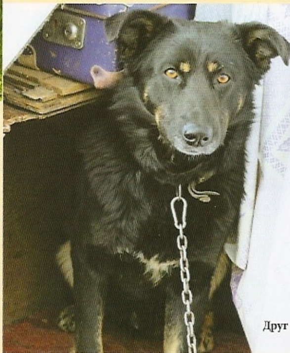
Друг и защитник – Рекс