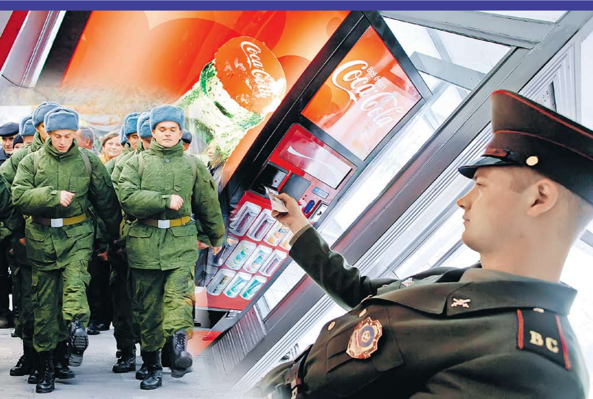
Коллаж Андрея СЕДУХ (фото ИТАР-ТАСС)