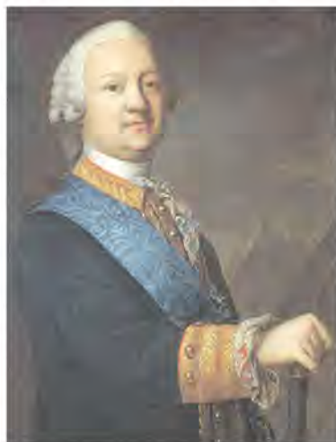
Граф Пётр Панин.

Об этой победе наших войск в Русско-турецкой войне 1768-1774 гг. отечественные историки вспоминают не часто, уж слишком дорогой ценой досталась нам сия виктория, большой кровью заплатили россияне за этот укрепленный пункт. Но большая политика требует больших жертв! Результатом взятия Бендер стал переход всего пространства между Днестром и Прутом под русский контроль.