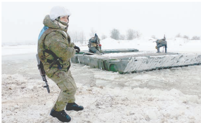
Тяжёлая работа понтонёров.