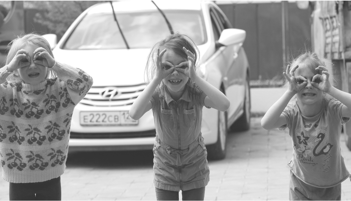
ВАЛЕРИЙ МАТЫШИН / ТАСС