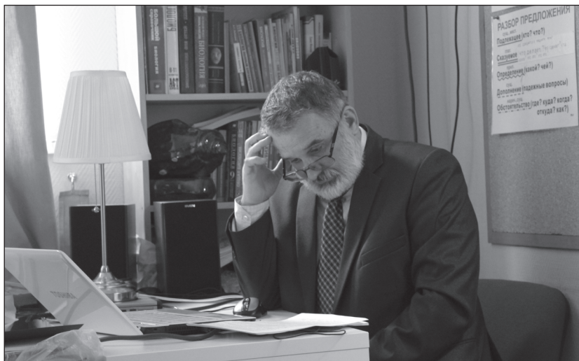
Всеволод Игоревич Вишневский. Фото В. В. Хухарева