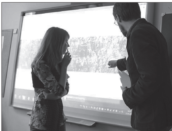
Рабочий момент конференции.