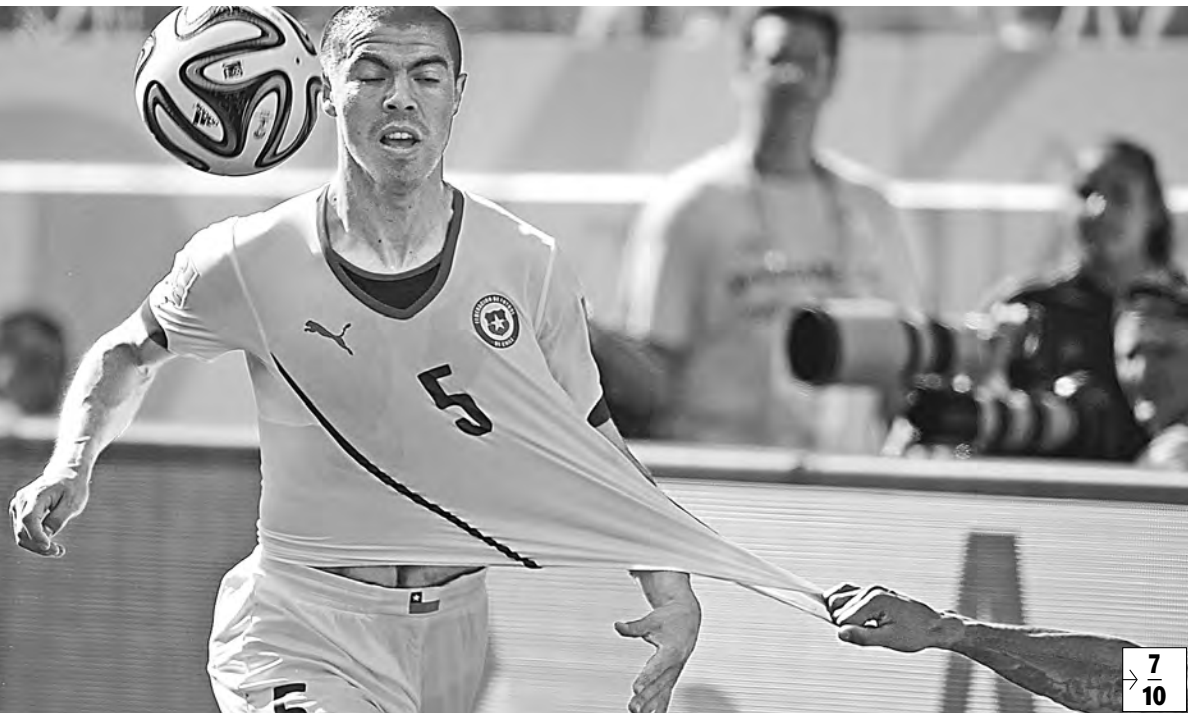
Программу матчей 1/8 финала чемпионата мира откроет игра с участием чилийцев (на фото) и сборной Бразилии.