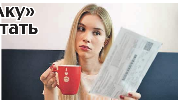
Светлана МАКОВЕВА / КП - Самара