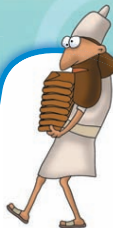
Самые необычные КОЛЛЕКЦИИ