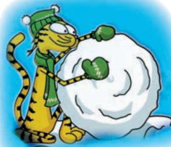
ВЕСЁЛЫЕ зимние ИГРЫ