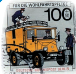
ПОЧТОВЫЕ МАРКИ Кто их придумал?