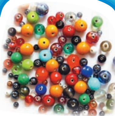
Плетём из БИСЕРА