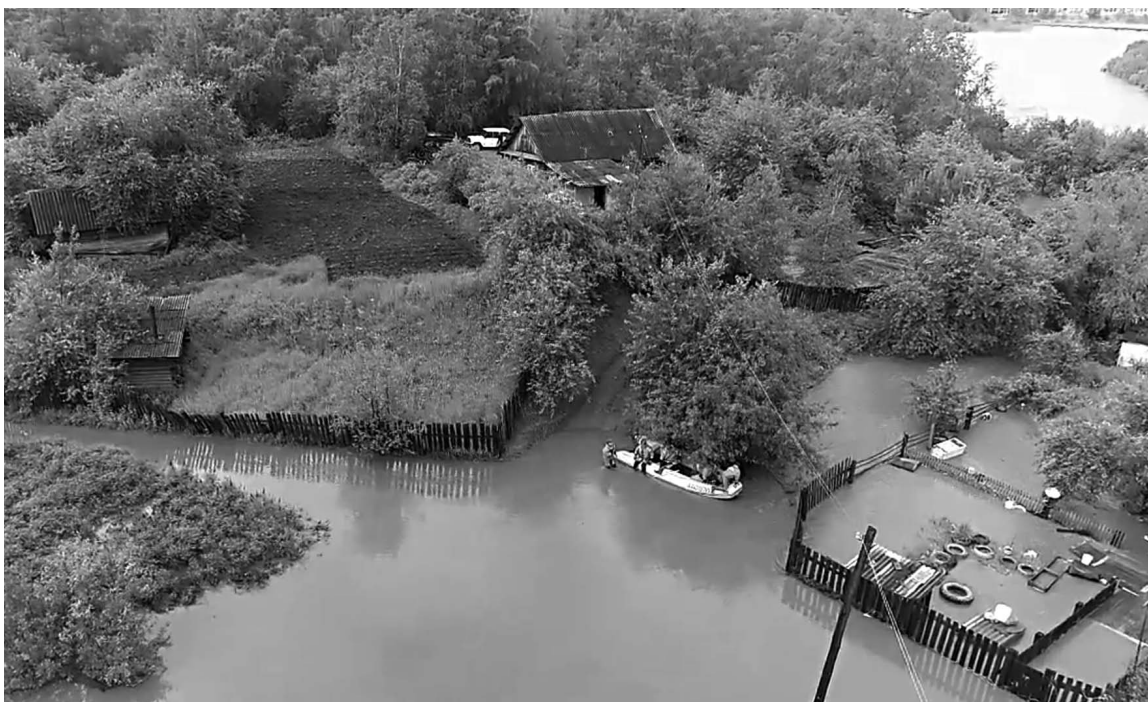
ГУ МЧС РОССИИ ПО ЗАБАЙКАЛЬСКОМУ КРАЮ