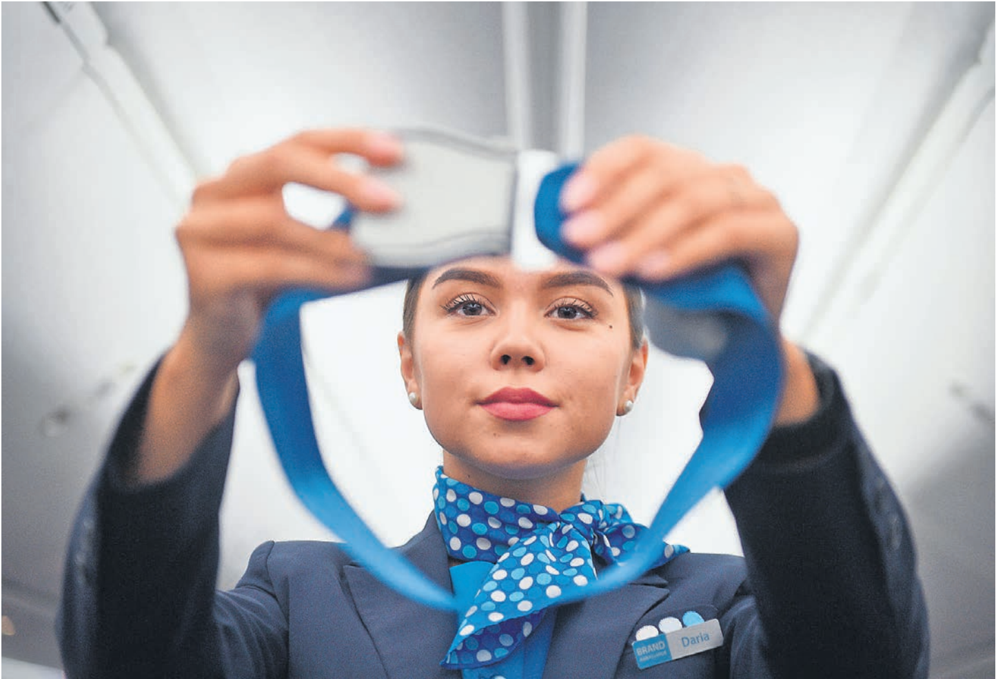
С 8 марта российские авиакомпании могут оказаться пристегнуты к земле из-за страховок

Евросоюз 26 февраля ввел санкции, за- прещающие поставки, продажу, лизинг, те- хобслуживание и страхование самолетов в России. Многие авиакомпании уже полу-