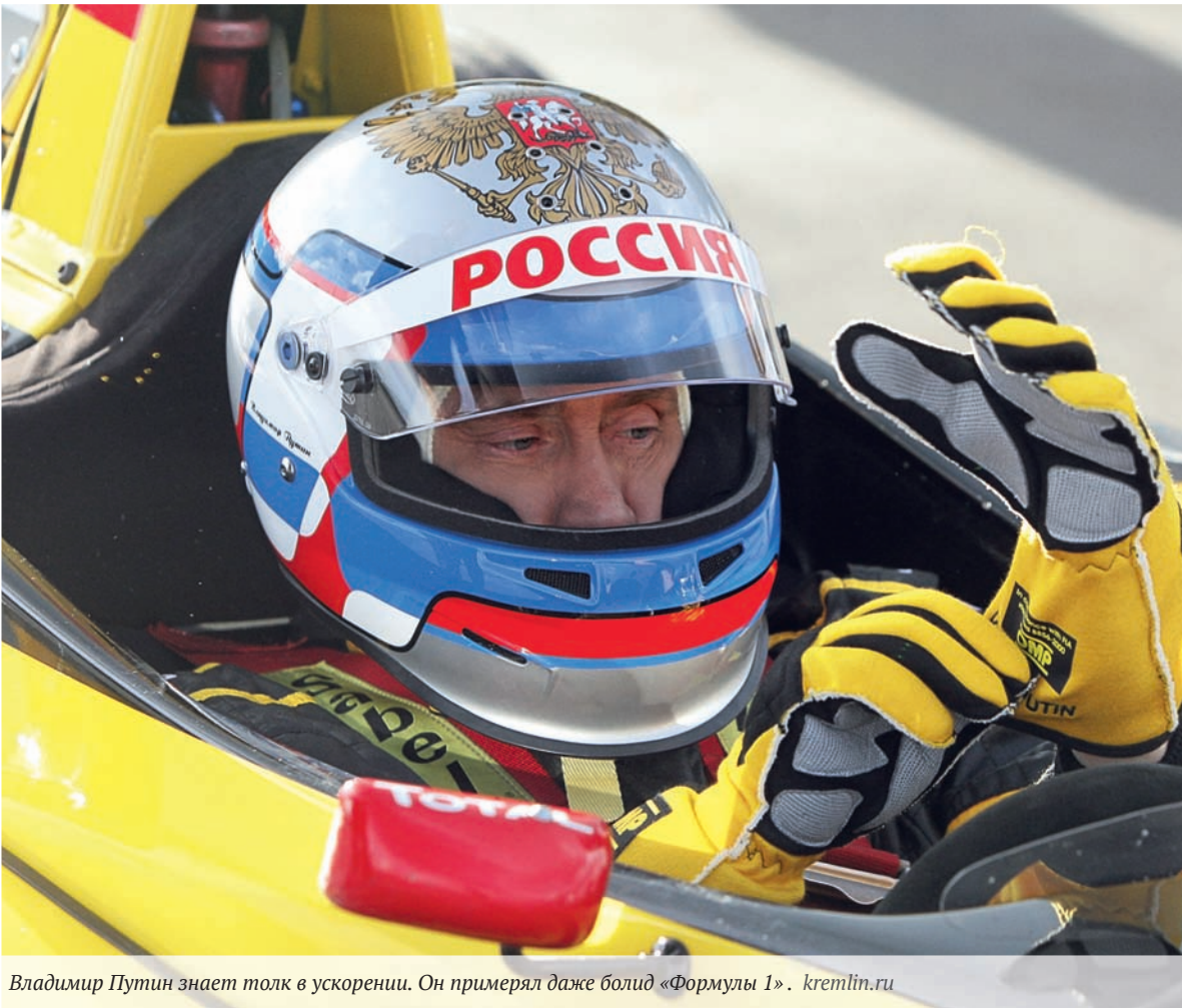
Владимир Путин знает толк в ускорении. Он примерял даже болид «Формулы 1». kremlin.ru

Один из крупнейших китайских сельхозпроизводителей «Хунань Цзиньчжоу Чай» планирует открыть производство чая и консервированных фруктов и соков в Московской области.