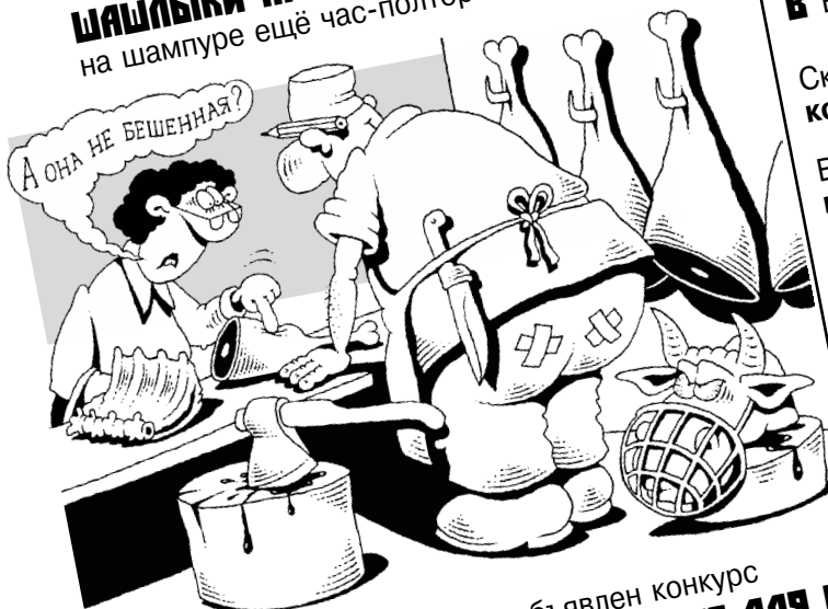
РИС. И. КИЙКО (АЛМАТЫ)

В Израиле объявлен конкурс НА ЛУЧШЕЕ НАЗВАНИЕ ДЛЯ СВИНОГО ГРИППА!