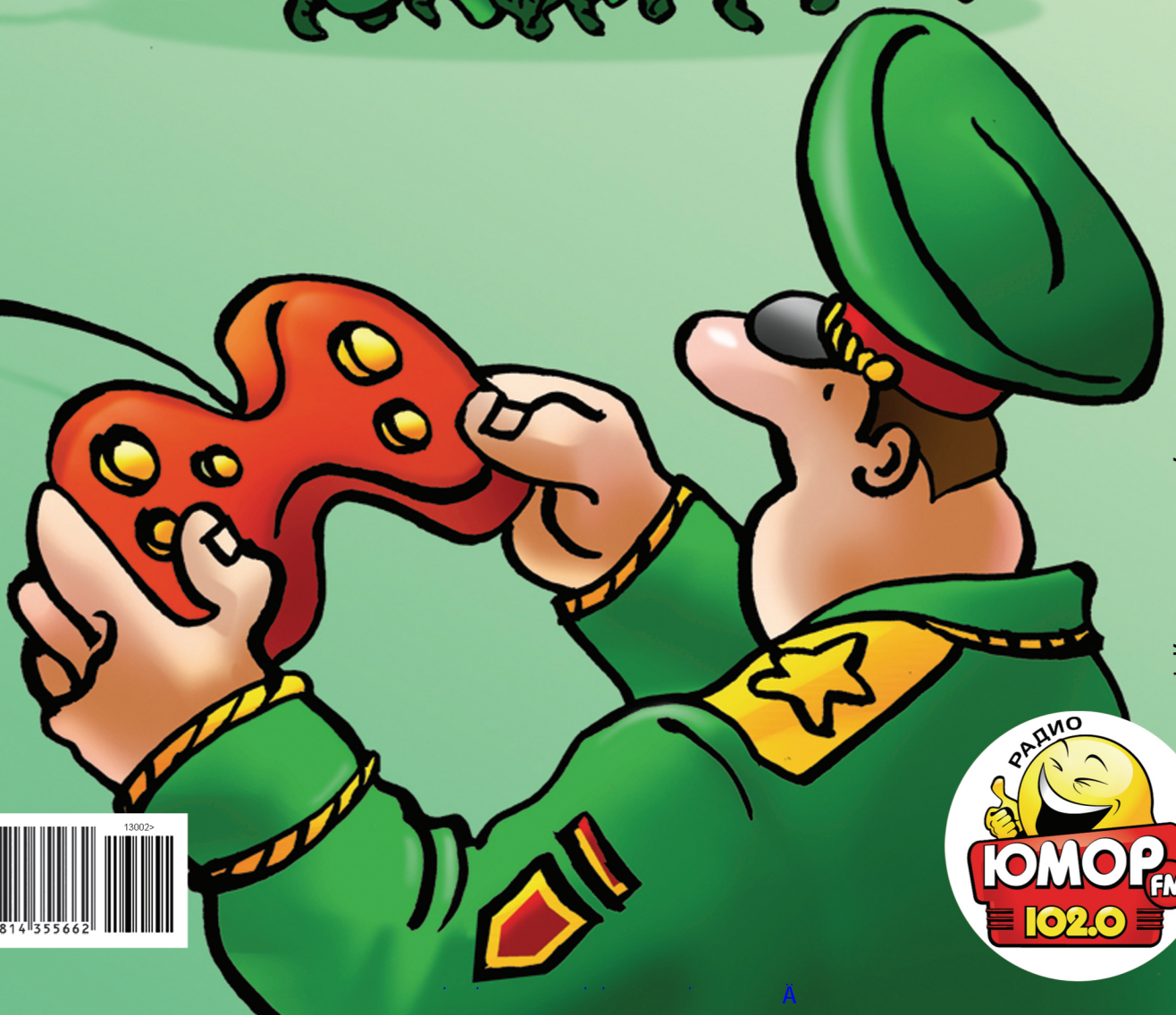
Рисунок Алексея Кивокурцева