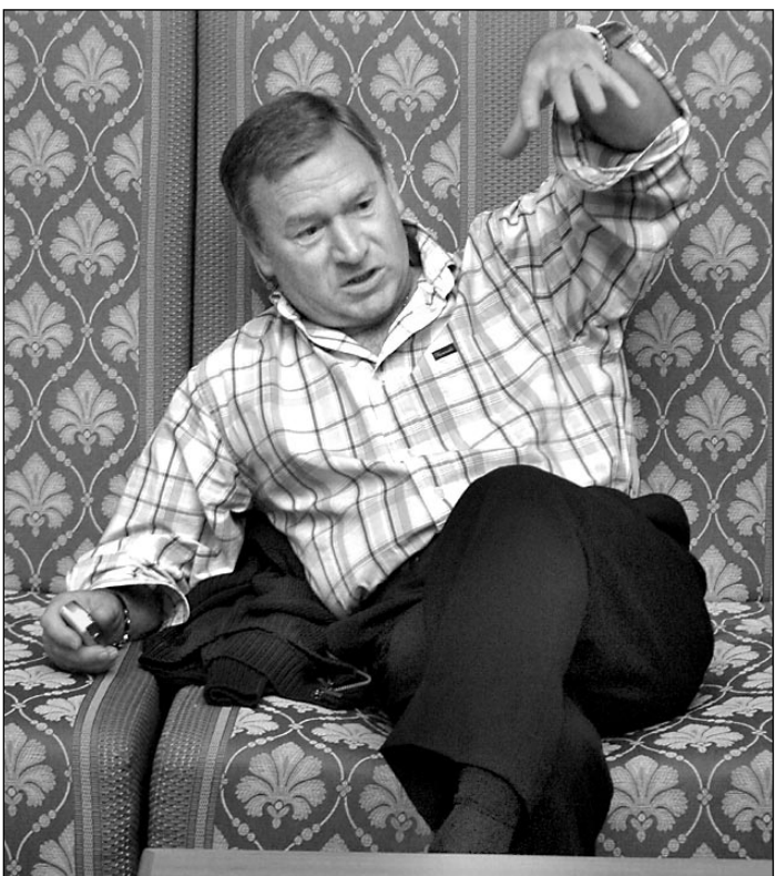
Вчера. Киев. Отель «Национальный». Хавьер КЛЕМЕНТЕ дает интервью «СЭ».

Интервью с Игорем Суркисом о кандидатах на пост главного тренера киевского «Динамо» - стр. 4