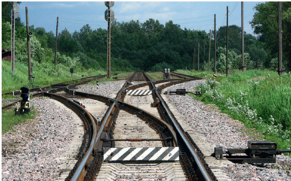
В будущем российской экономики есть несколько развилок, и некоторые из дорог ведут в тупик. time.com

Госдума приняла в первом чтении правительственный законопроект, увеличивающий МРОТ с 2019 года до 11 280 руб. – до размера прожиточного минимума. Отмечается, что это позволит обеспечить рост зарплат у около 3,7 млн работников.