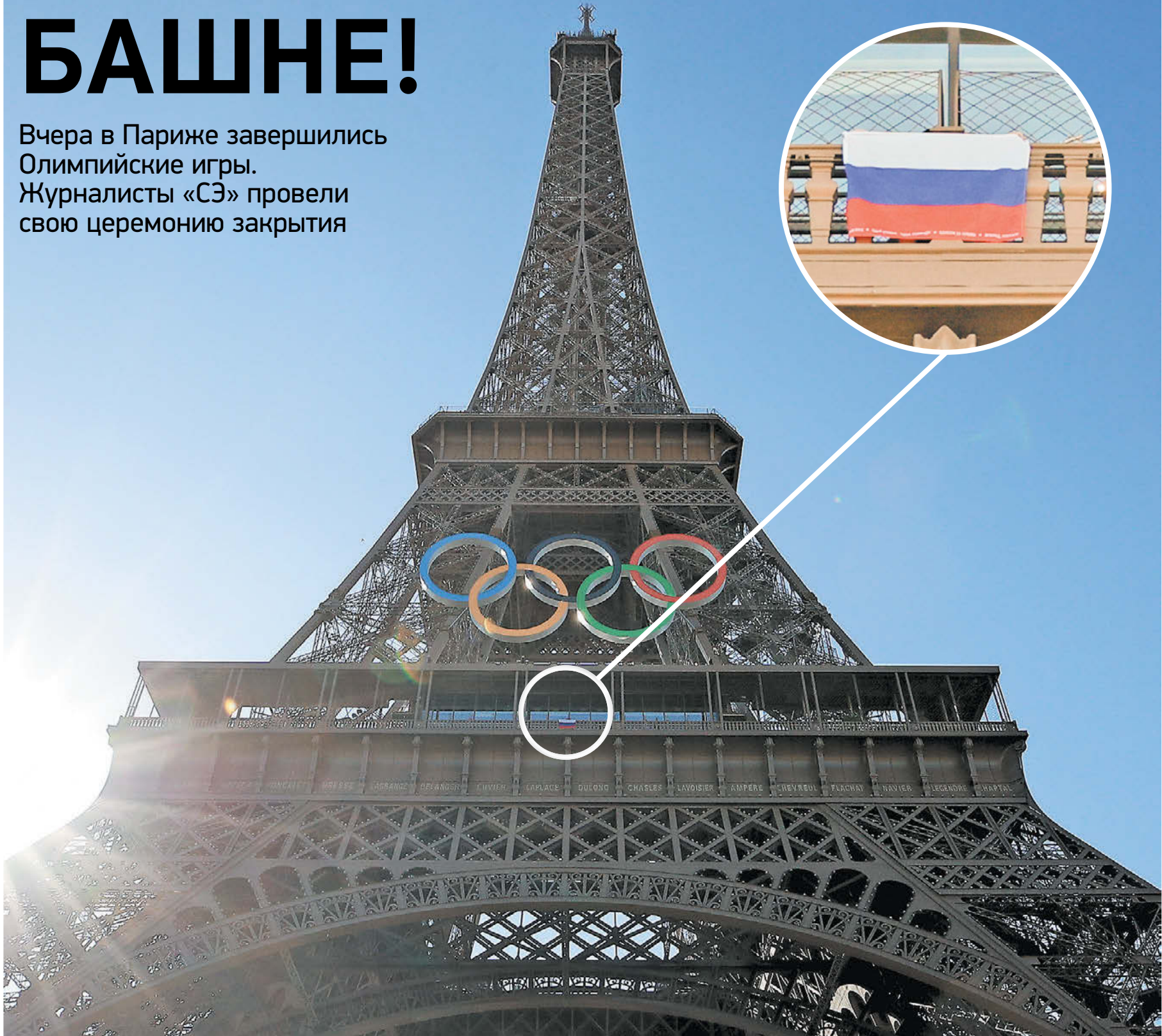
Вчера. Париж. Российский флаг на Эйфелевой башне