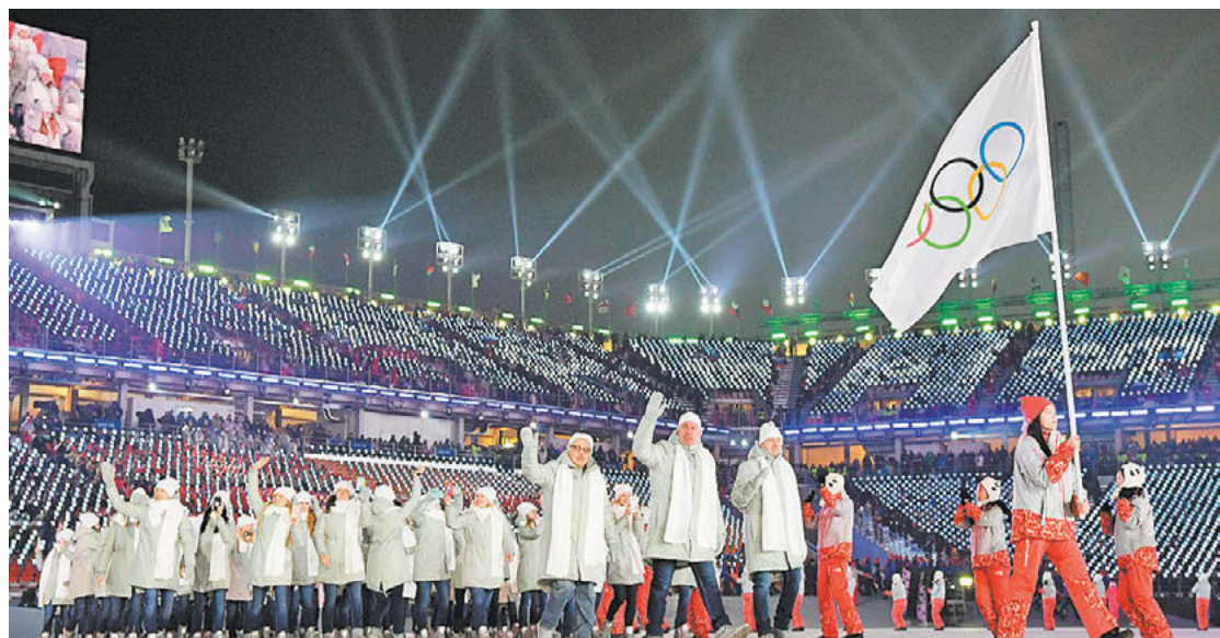
9 февраля 2018 года. Пхенчхан. Четыре года назад Россию на зимней Олимпиаде представляли 168 спортсменов