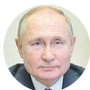
Владимир Путин, президент РФ