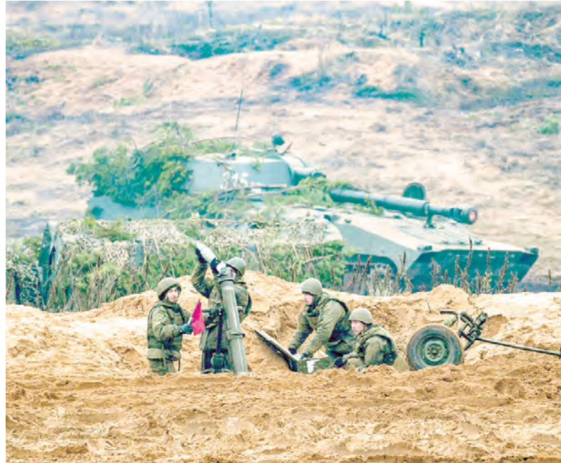
Огонь ведут миномётчики

тренировок по ведению разведывательно-ударных действий (10 мероприятий), на которых практически отрабатывали навыки управления подчинёнными соединениями и частями в ходе нанесения огневого поражения противнику. Проведено две тренировки по обмену информационными ресурсами с использованием комплекса «Территория», обучение на оперативно-мобилизационном сборе руководящих должностных лиц ВС РФ, две совместные и комплексные тренировки по вопросам боевой и мобилизационной готовности для достижения слаженных действий управления в ходе выполнения функциональных обязанностей при приведении в высшие степени боевой готовности, три совместные и командно-штабные тренировки под руководством начальника штаба округа, шесть КШТ, учений и оперативно-полевых поездок под руко-