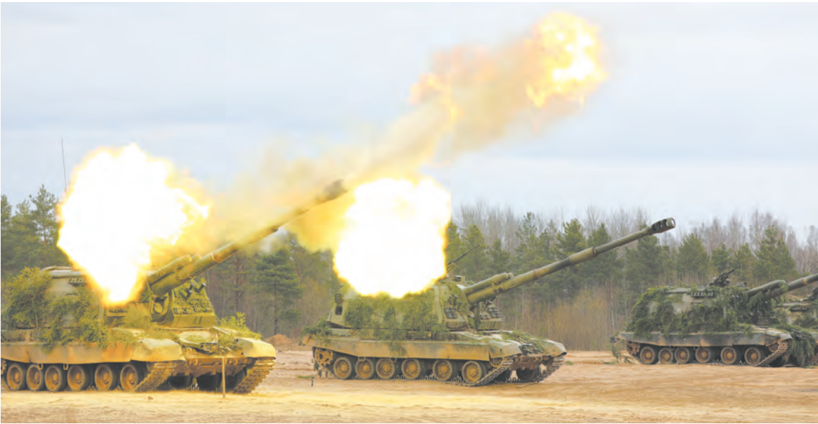
Сегодня огневая мощь РВиА существенно возросла

водством командующего войсками Западного военного округа.