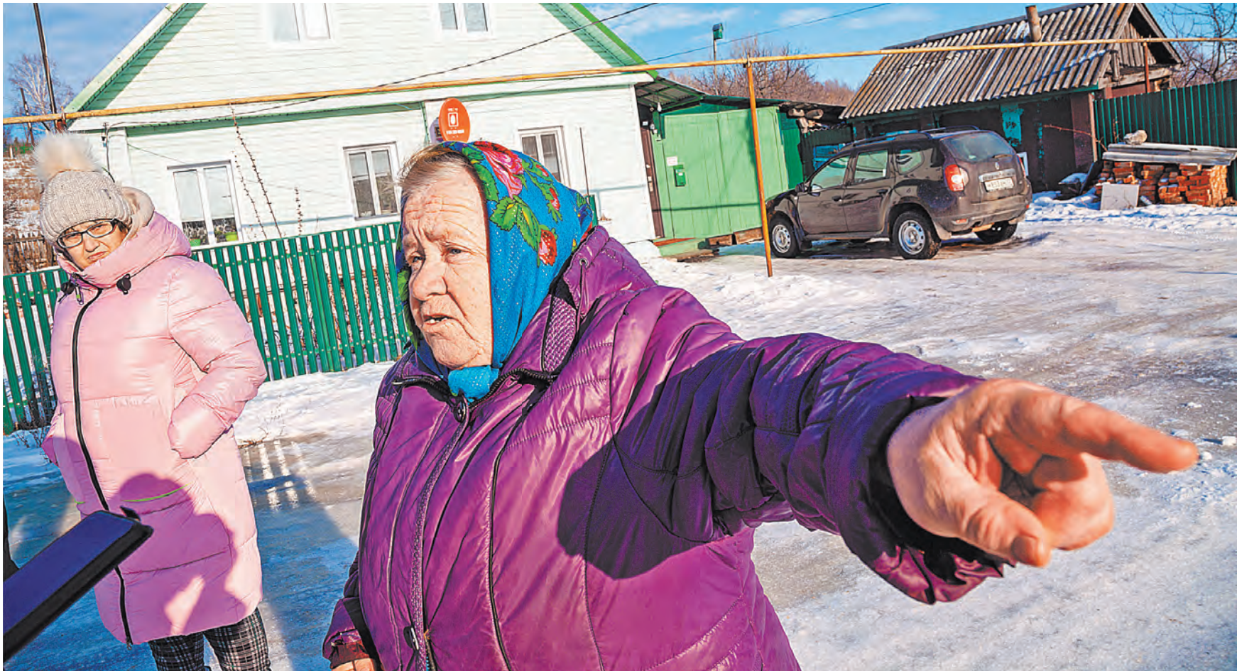
Жители села Большая Поляна никак не могут понять, почему надо посадить на нары человека за то, что он им бескорыстно помог.