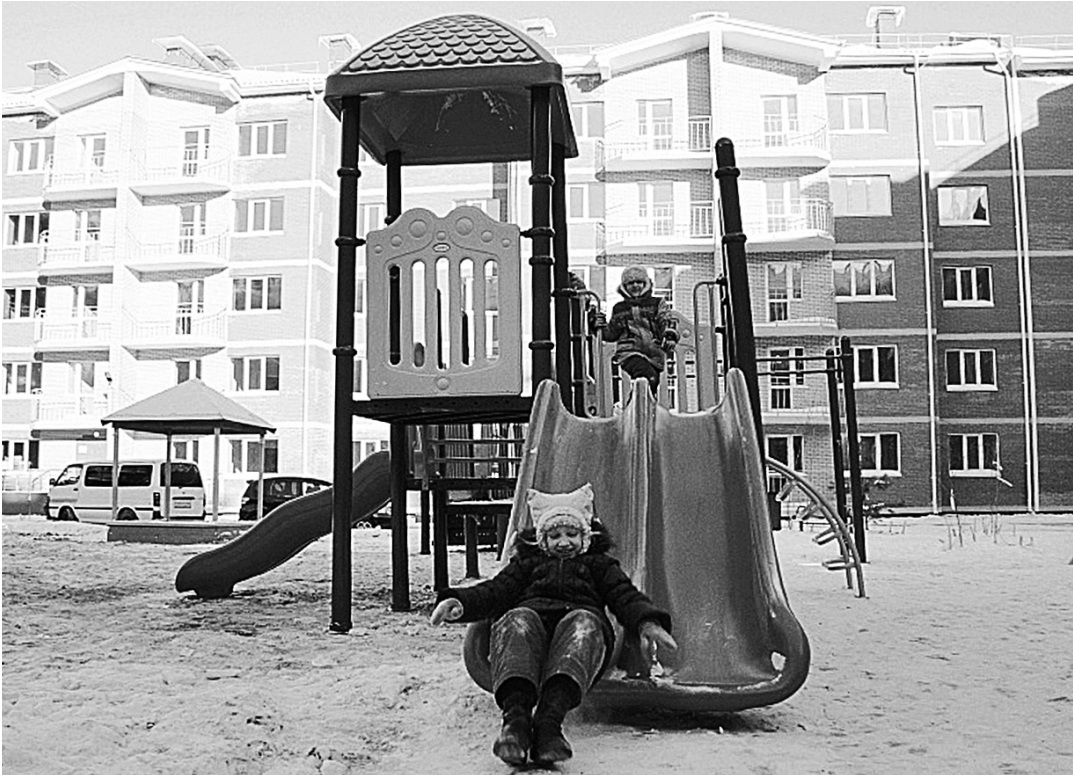
ПРЕСС-СЛУЖБА АДМИНИСТРАЦИИ ХАБАРОВСКА