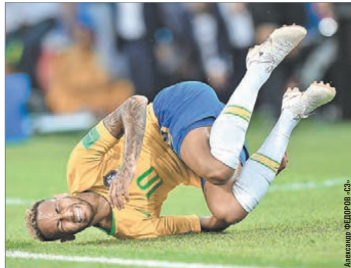
Александр ФЕДОРОВ «СЭ»

Главную звезду бразильской сборной обвиняют в картинности падений, актерстве и симуляциях. Но оправдана ли критика Неймара, на котором фолят чаще, чем на Месси и Криштиану?