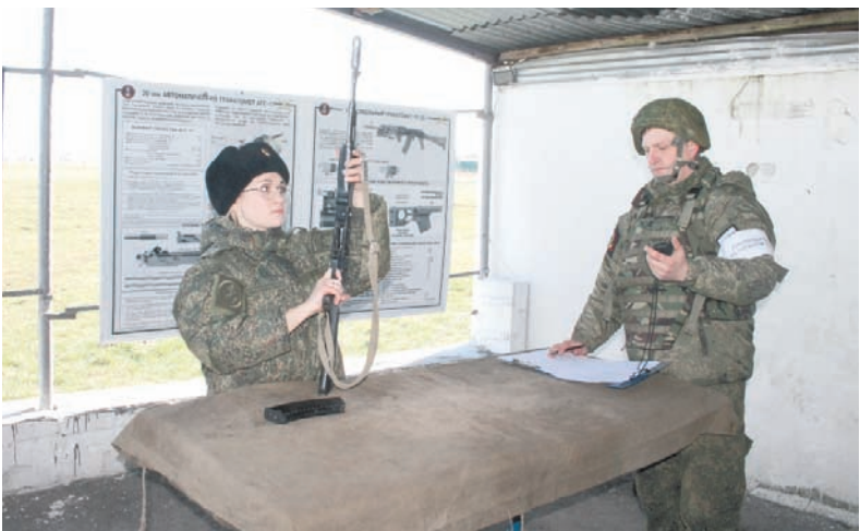
Разобрать и собрать автомат – за считанные секунды!