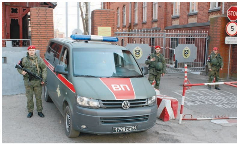
На учениях по проверке порядка допуска на территорию воинской части.

Юрий ДМИТРИЕВ, фото автора и Департамента информации и массовых коммуникаций МО РФ.