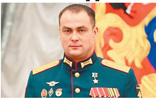
АДМИНИСТРАЦИЯ ПРАВИТЕЛЬСТВА ЛУГАНСКОЙ НАРОДНОЙ РЕСПУБЛИКИ