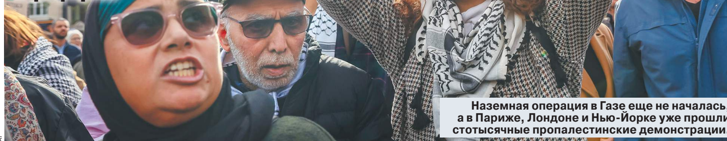
Наземная операция в Газе еще не началась, а в Париже, Лондоне и Нью-Йорке уже прошли сотысячные пропалестинские демонстрации.

Украина уже к концу года рискует превратиться из геополитического центра мира в его геополитическую периферию