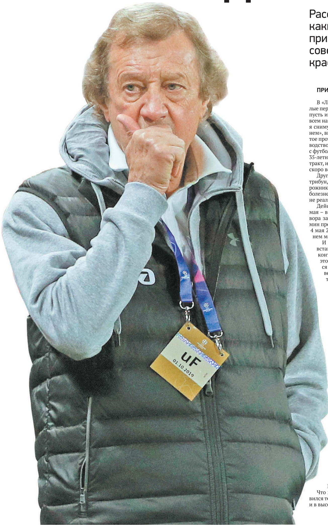
Главный тренер «Локомотива» Юрий Семин