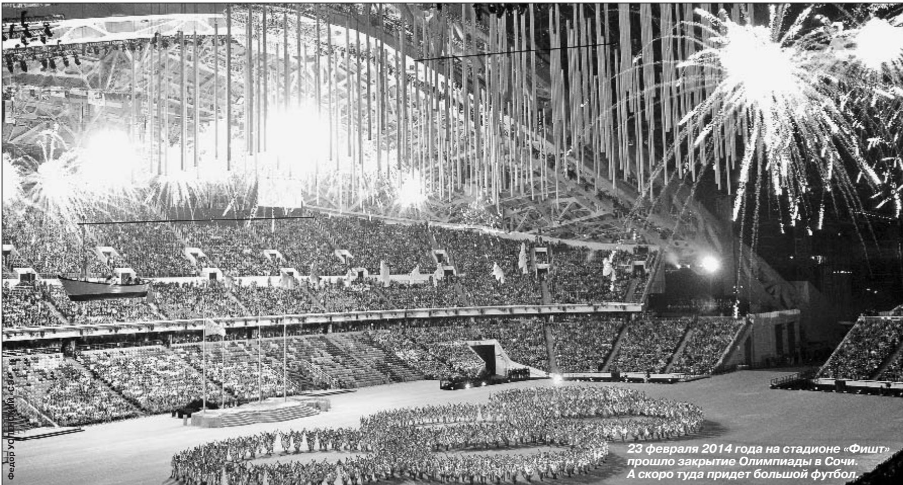
23 февраля 2014 года на стадионе «Фишт» прошло закрытие Олимпиады в Сочи. А скоро туда придет большой футбол.

Министр спорта объявил о скором переезде в Сочи футбольного клуба. По информации «СЭ», им может стать краснодарская «Кубань».