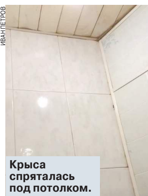
Крыса спряталась под потолком.

От незваной гостьи — уличной крысы, которая в ночь на 14 апреля залезла в жилое помещение через унитаз, пытались избавиться хозяйку квартиры в центре Москвы московские спасатели.