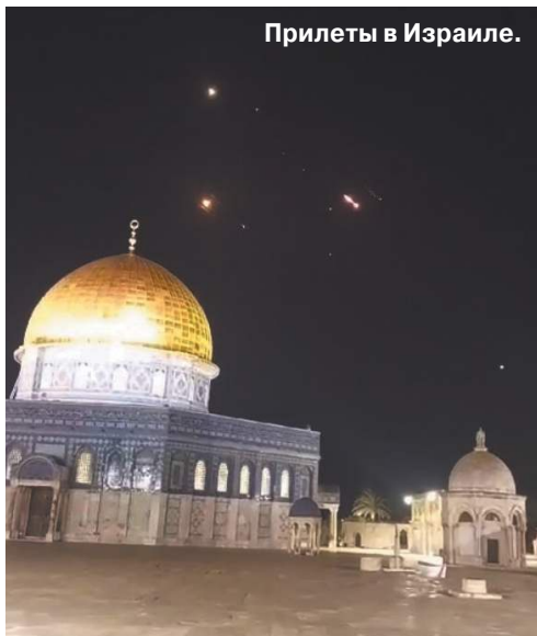
Прилеты в Израиле.