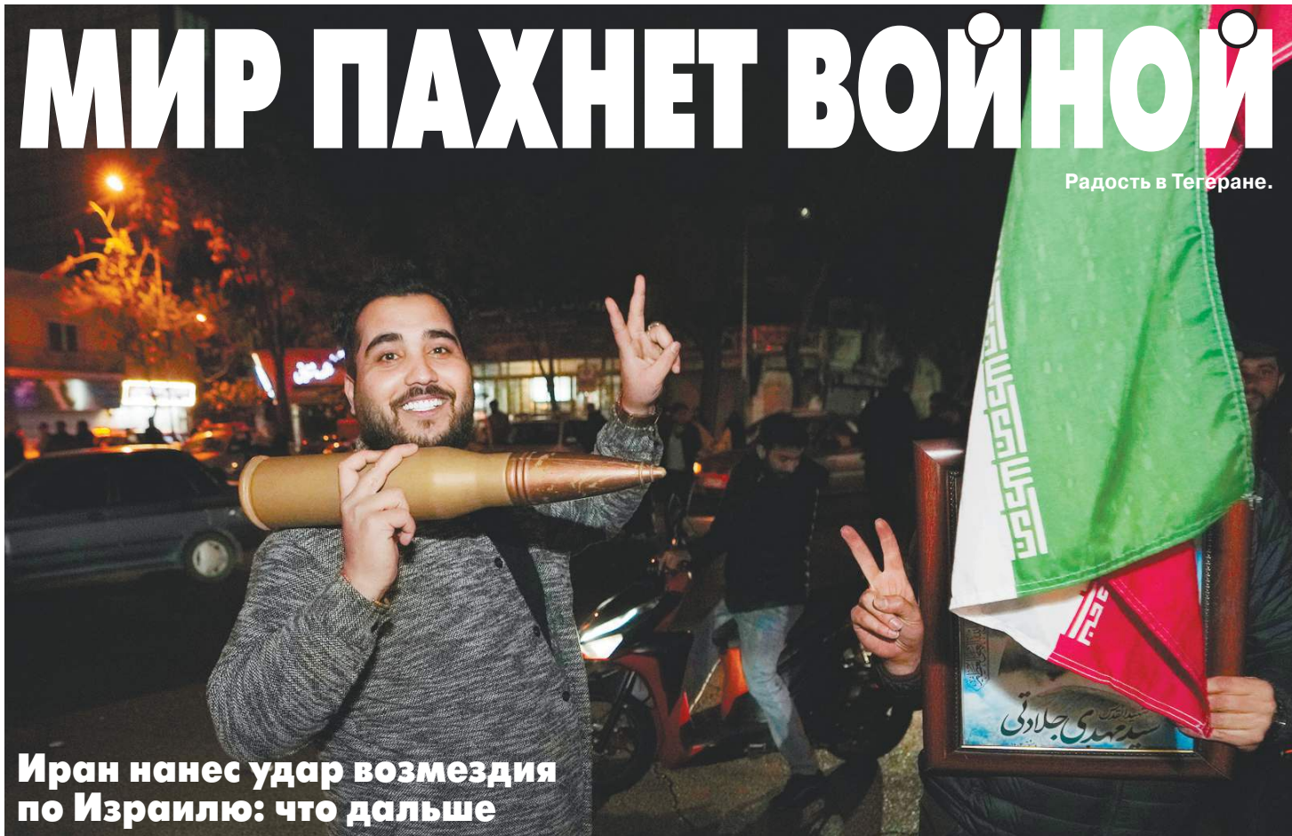
Радость в Тегеране.