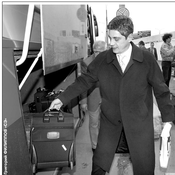
Вчера. Москва. Главный тренер «Эфес Пилсен» Махмут ОКТАЙ в аэропорту Шереметьево-2.

От результата сегодняшнего матча зависит, кто попадет в «Финал четырех». Если ЦСКА выиграет с разницей в 3 очка или крупнее, он в тот же день может обеспечить себе 1-е место в группе D и путевку в Барселону. Матч с «Эфес Пилсен», который вчера прилетел в Москву, начнется сегодня в 20.00 в УСК ЦСКА на Ленинградском проспекте.