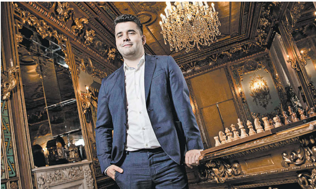
27 июня. Мадрид. Ян Непомнящий