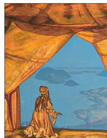
Н.К. Рерих. Властитель ночи. 1918. Фанера, масляная темпера, 72,8×79 см. Музей Николая Рериха, Нью-Йорк