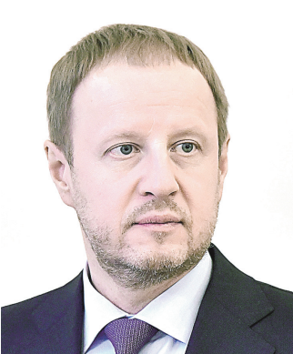
Виктор Томенко, губернатор Алтайского края

Главное, что мы верны нашим договоренностям. Они всесторонне проработаны. По итогам реализации инвестиционного проекта получим современный аэропорт, более чем в два раза увеличим его мощности по обслуживанию пассажиров, сделаем его современным, комфортным для сибирских условий. Нашим планом предусмотрено увеличение его мощностей и в перспективе. Не позднее чем через два года должна начаться непосредственно стройка. А не позднее чем через четыре года строительство-монтажные работы должны быть закончены, и объект введен в эксплуатацию.