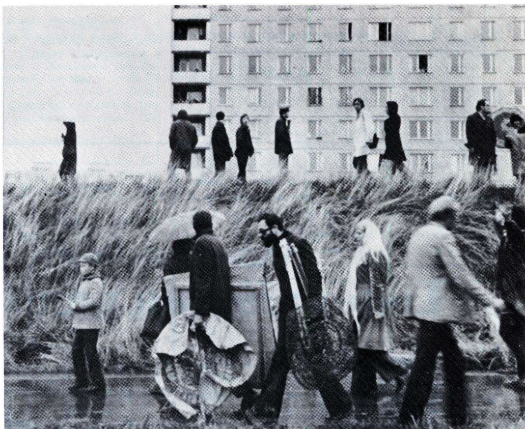
После «художественной критики» на Профсоюзной улице

ЕЖЕМЕСЯЧНЫЙ ОБЩЕСТВЕННО-ПОЛИТИЧЕСКИЙ ЖУРНАЛ