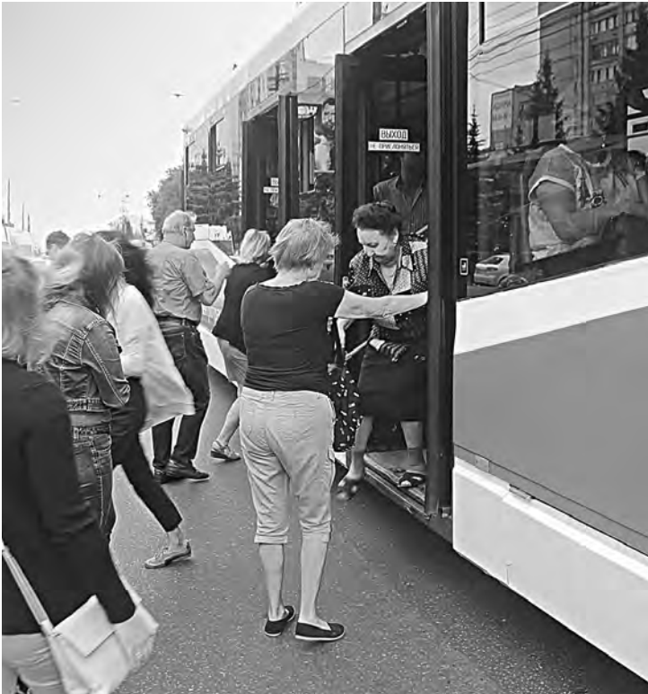
Маломобильным гражданам заходить в низкопольный трамвай стало гораздо проще.