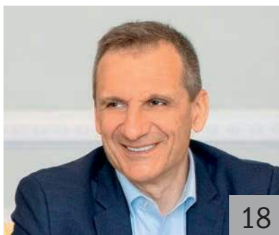
Р. И. МАРКОВ, первый заместитель председателя Правительства Ленинградской области