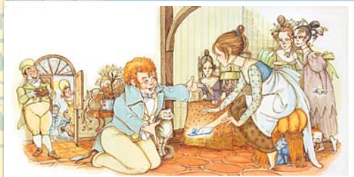
Hilary Knight (США, 2001)