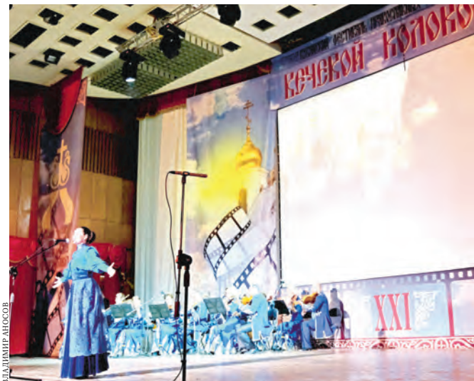
На фестивале зрителям покажут 186 фильмов.