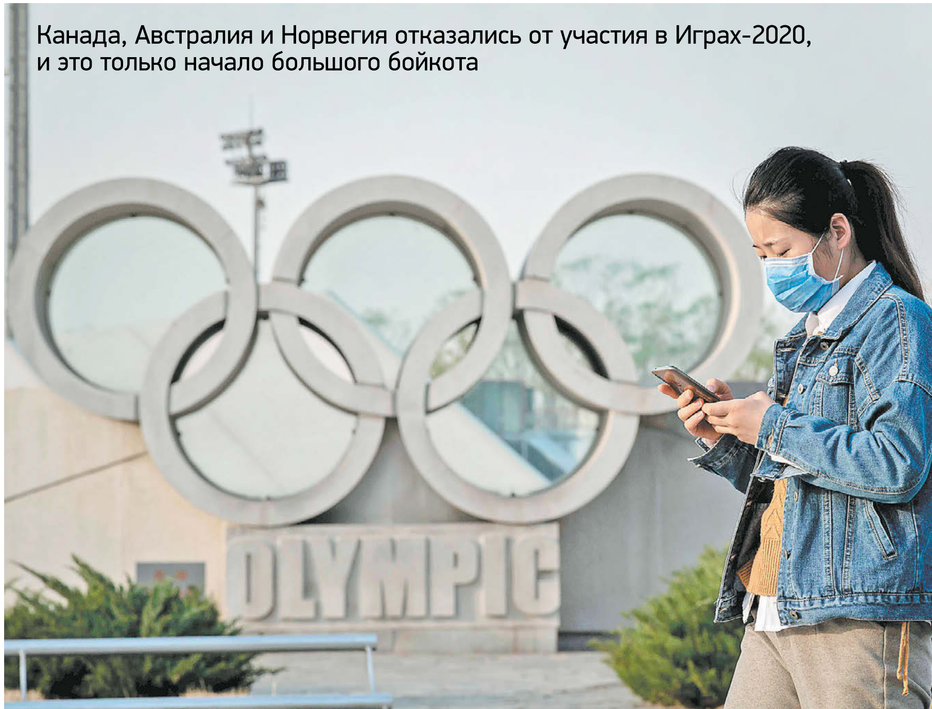
Олимпиада в Токио, вероятно, будет перенесена

Канада, Австралия и Норвегия отказались от участия в Играх-2020, и это только начало большого бойкота